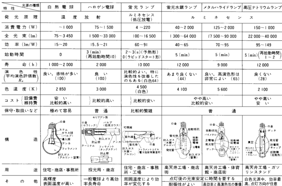
表 主な光源の性能と特徴 (出典：参考文献 [1], p. 37)