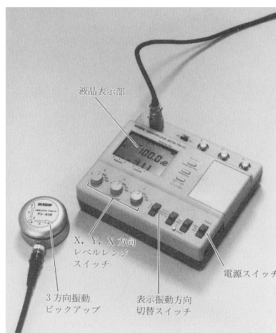
図 振動レベル計と振動ピックアップ