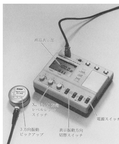
図 振動レベル計と振動ピックアップ