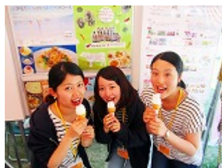
頑張ってくれた食健康科学科の4年生のスタッフ