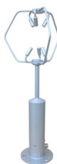
写真 超音波風速計*2