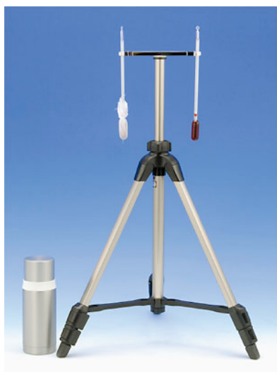
写真 カタ寒暖計 (カタ温度計)