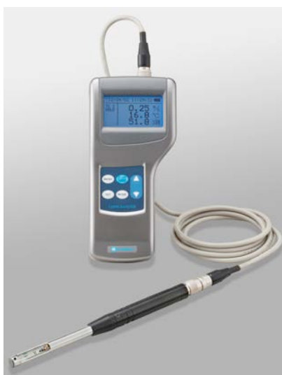
写真 熱線式風速計*1