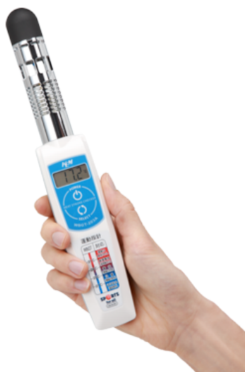
写真 WBGT 計