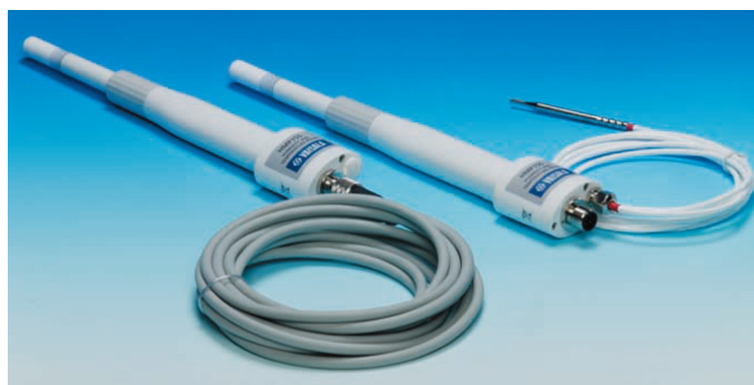
写真 湿度温度プローブ*1