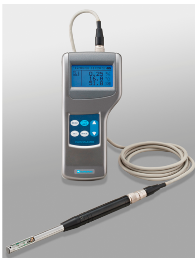
写真 熱線式風速計*1