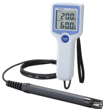
写真 デジタル温湿度計*2 (出典：佐藤計量器製作所の HP)