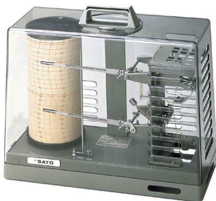
写真 自記式温度計