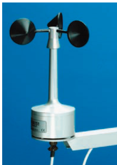
写真 三杯式風速計 (注意)