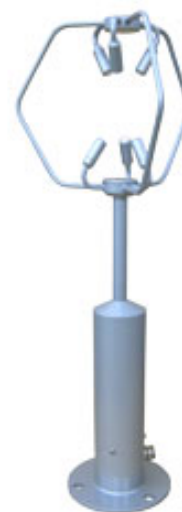
写真 超音波風速計*2