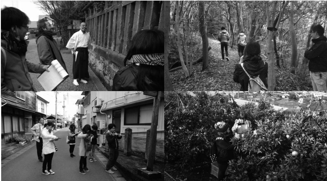
図3 玉名市内4地域での同時フィールド調査