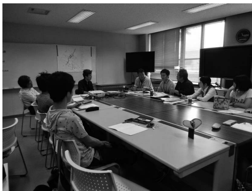
図2 玉名市観光係担当者との第1回会議