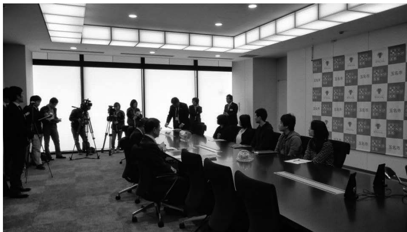
図5 玉名市長に対する映像発表会