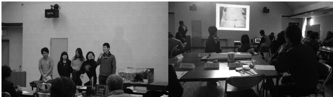
図4 玉名観光戦略会議にて制作した観光PR映像の発表と評価